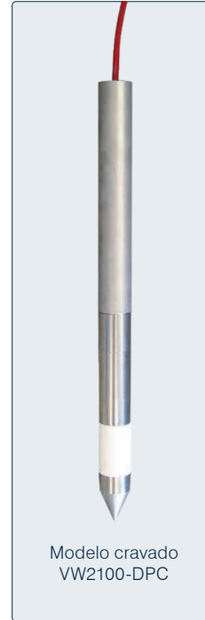
Modelo cravado VW2100-DPC