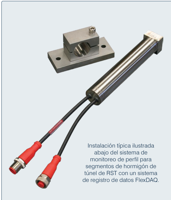
Instalación típica ilustrada abajo del sistema de monitoreo de perfil para segmentos de hormigón de túnel de RST con un sistema de registro de datos FlexDAQ.